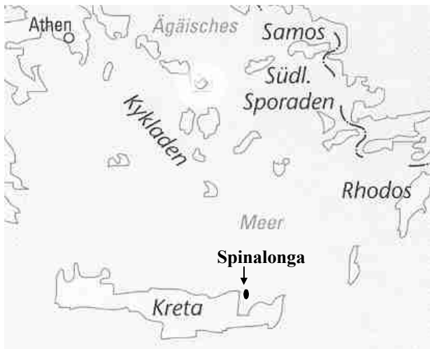
Karte: Spinalonga, eine Insel im Osten von Kreta