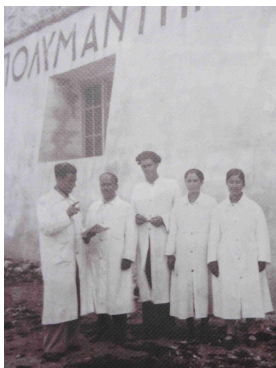
Bild 5: Pflegende auf Spinalonga (Foto auf einer Tafel im Infozentrum von Spinalonga)