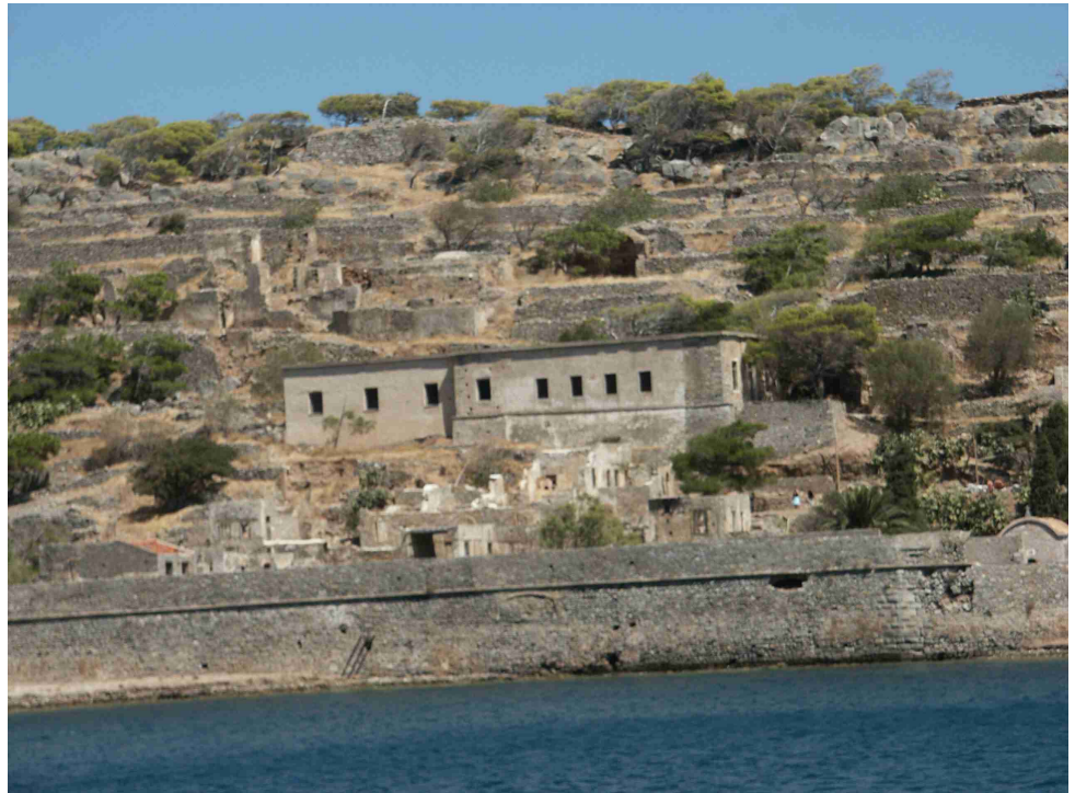
Bild 1: Blick auf Spinalonga, das Gebäude in der Bildmitte ist das ehemalige Krankenhaus

„Inseln“ der Aussätzigen - Teil 2 folgt in der nächsten Ausgabe - vermittelt Einblicke in das Leben an Lepra erkrankter Menschen einschließlich ihrer medizinischen und pflegerischen Betreuung.